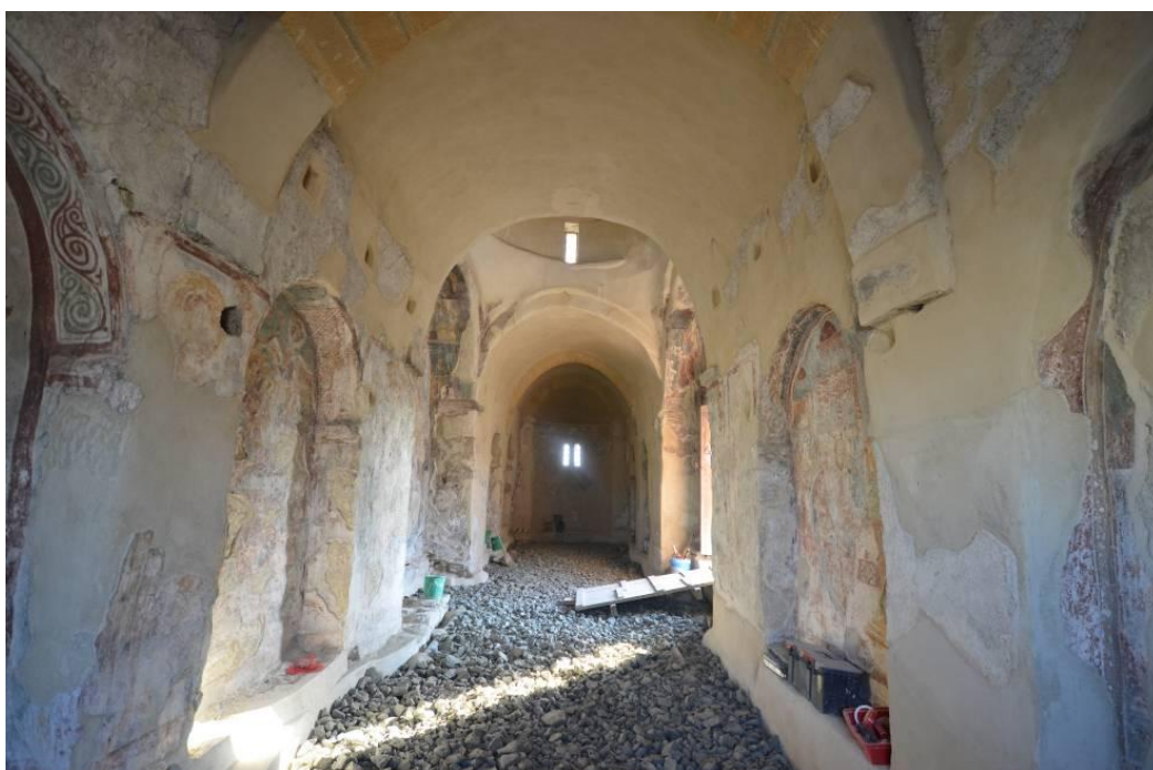
Κοφίνου, Παναγία: Ολοκλήρωση επίχρισης εσωτερικών επιφανειών