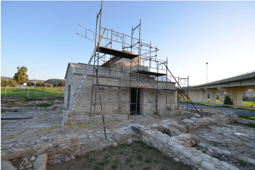
Καντού, Αγία Μαρίνα: Ολοκλήρωση αποκατάστασης ναού. Άποψη από ΝΔ