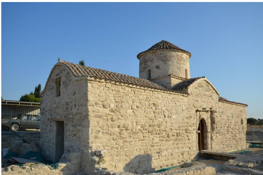
Κοφίνου, Παναγία: Ολοκλήρωση αποκατάστασης τοιχοποιίας. Άποψη από ΝΔ