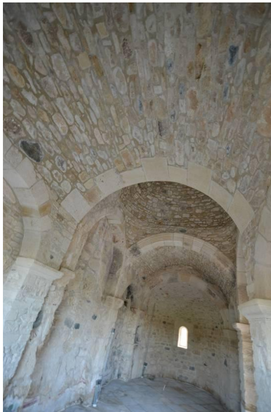
Καντού, Αγία Μαρίνα: Άποψη εσωτερικού