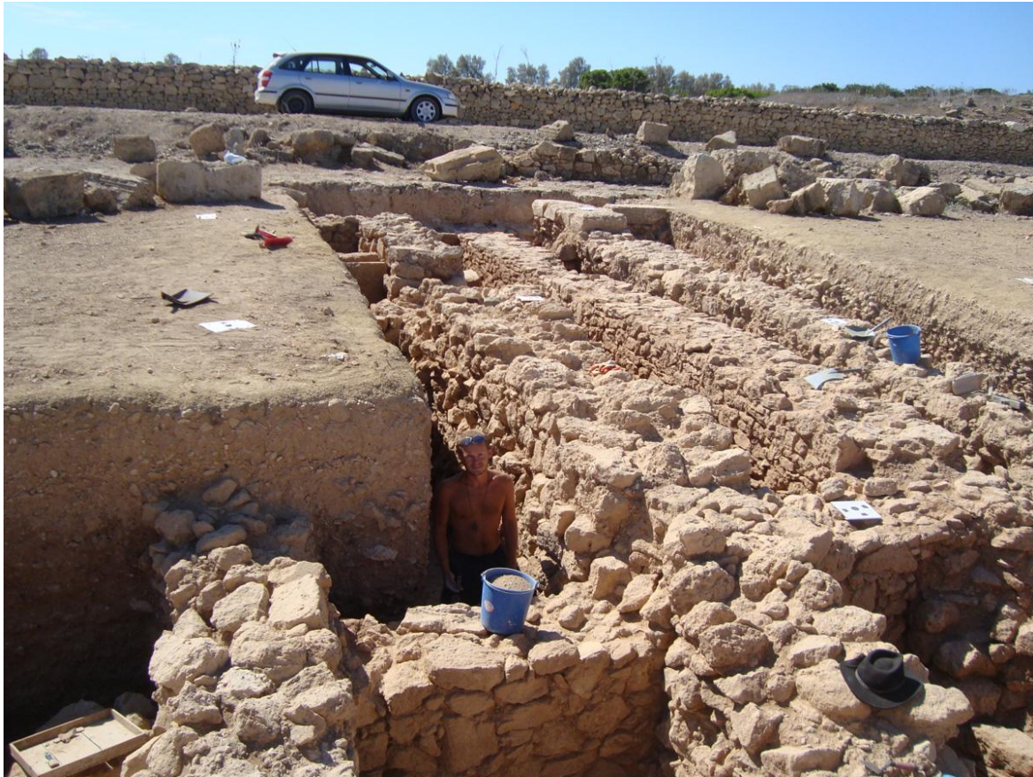
Εργασίες στην Τομή ΙΙΙ

Από το 2013 ένας εκ των στόχων του προγράμματος είναι η εξέλιξη ενός νέου συστήματος τεκμηρίωσης με την ονομασία «The Archaeological and Archaeometric Information System for the Pafos Agora Project» (AIS for PAP). Το σύστημα αυτό θα συνδέει την παραδοσιακή αρχαιολογική τεκμηρίωση με το Digital Elevation Model (DEM) και θα συσχετίζονται με τη βάση δεδομένων και ορθοφωτοχάρτη μέσω του Συστήματος Γεωγραφικών Πληροφοριών.